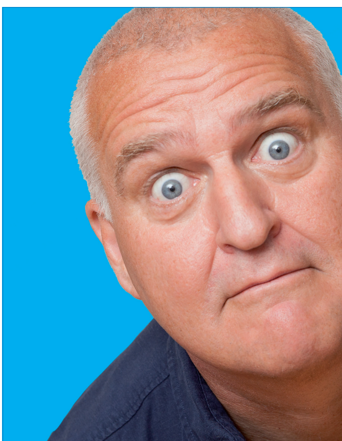
Markus Maria Profitlich

Sendung „Deutschland ist schön“. Schon bei den Studioaufzeichnungen war Profitlich der Kontakt zum Publikum wichtig – bei seiner Rückkehr auf die große Comedybühne ist die enge Zuschauerbindung für den Entertainer „Mensch Markus“ ein unverzichtbarer Bestandteil. Bei seinen Live-Shows zeigt er seit 1988 was für ihn Comedy bedeutet – eine umwerfende körperliche Energie, Wandlungsfähigkeit und zielsichere Angriffe auf die Lachmuskeln, gepaart mit großer Menschlichkeit. Die Show startet am 6. Dezember um 20 Uhr in der Kulturhalle. Tickets gibt es bei allen bekannten Vorverkaufsstellen sowie im Internet unter www.voelklinger-kulturmeile.de.