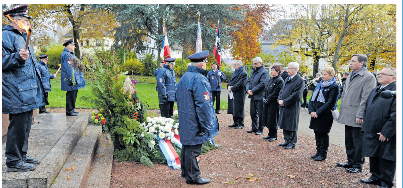
Kranzniederlegung am Ehrenfriedhof

tern der französischen Partnerstadt aus Forbach die Kränze nieder. Die Feier wurde durch Musikbeiträge und mit Feuerwehrleuten der Altersabteilung der Feuerwehr Völklingen begleitet. Auch in Ludweiler, Geislautern, Wehrden, Lauterbach und in Fürstenhausen wurden den Opfern mit Gedenkfeiern gedacht.