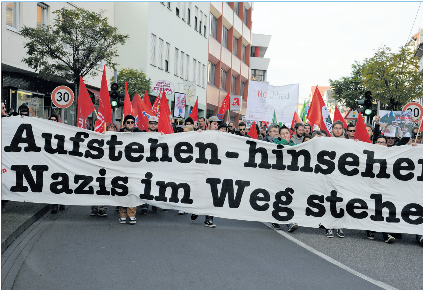
300 Menschen demonstrierten gegen den Aufmarsch der Rechtsextremen am vergangenen Samstag in der Völklinger Innenstadt.

Für unverlangt eingesandte Artikel übernimmt die Redaktion keine Haftung.