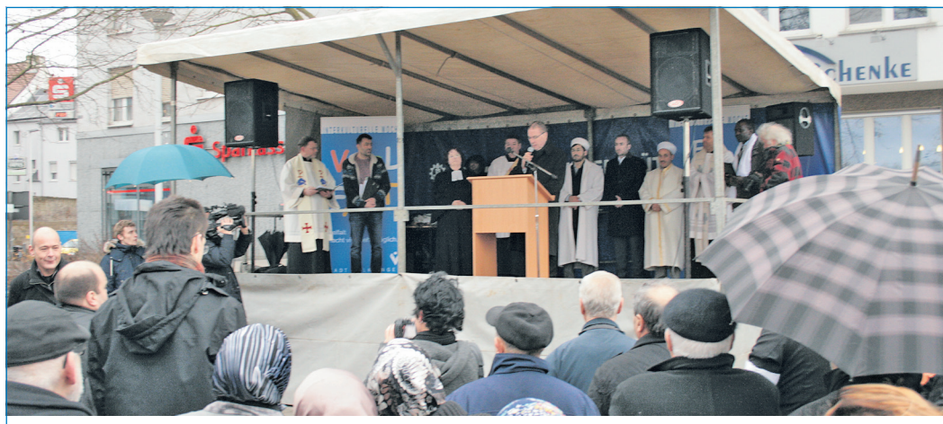
Vertreter der Religionen trafen sich zur Mahnwache am Wehrdener Platz.

Mahnwache am Wehrdener Platz mit Vertretern der Religionen