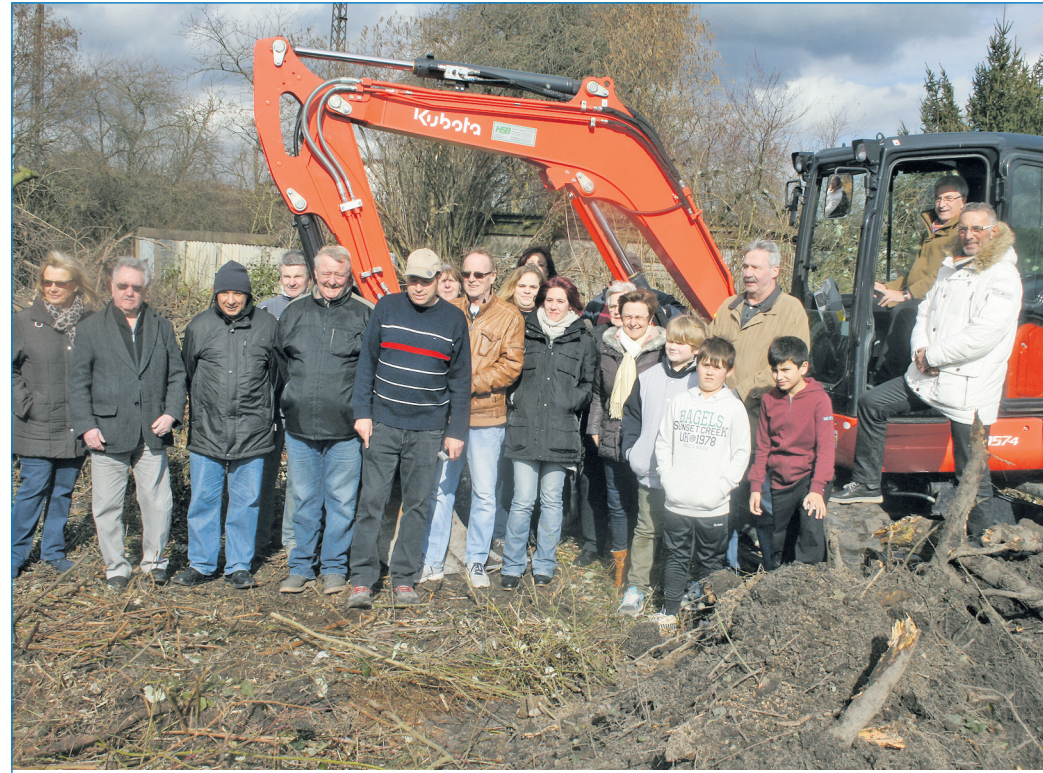
Großer Bahnhof beim Spatenstich mit Oberbürgermeister Klaus Lorig (2. von rechts) in Fürstenhausen.

zung am 13. November 2014 die Neuplanung der Sportanlage auf Grundlage des Bebauungsplanes beschlossen. Das Rasensportfeld bleibt grundsätzlich an seinem Standort bestehen. Es wird an die FIFA-Vorgaben angepasst und von der Wohnbebauung in Richtung Bahndamm verschoben. Durch die Vorgaben der Landesplanung ist es erforderlich, den Ersatzneubau des Umkleidegebäudes auf der Ostseite des Platzes zu errichten. An Stelle des jetzigen Umkleidegebäudes soll ein Multifunktions-spielfeld entstehen, das dann auch den Jugendlichen des Stadtteils zur Verfügung