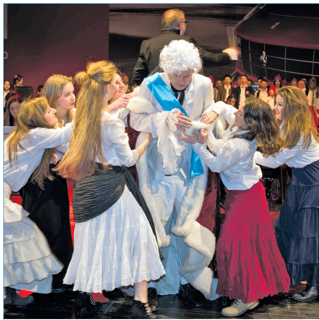
Blick in die Szenerie bei einem vergangenen Konzert der Gymnasien in der Gebläsehalle.

Die Handlung dreht sich um die Fragen: Was wäre, wenn Jacques Offenbach nicht am 5. Oktober 1880 in Paris gestorben ist? Was wäre, wenn er seine Figuren wie die Puppe Olympia der Oper „Hoffmanns Erzählungen“ aus dem Fegefeuer der Operninszenierungen retten wollte? Was wäre, wenn er sie über die Jahrhunderte an unseren