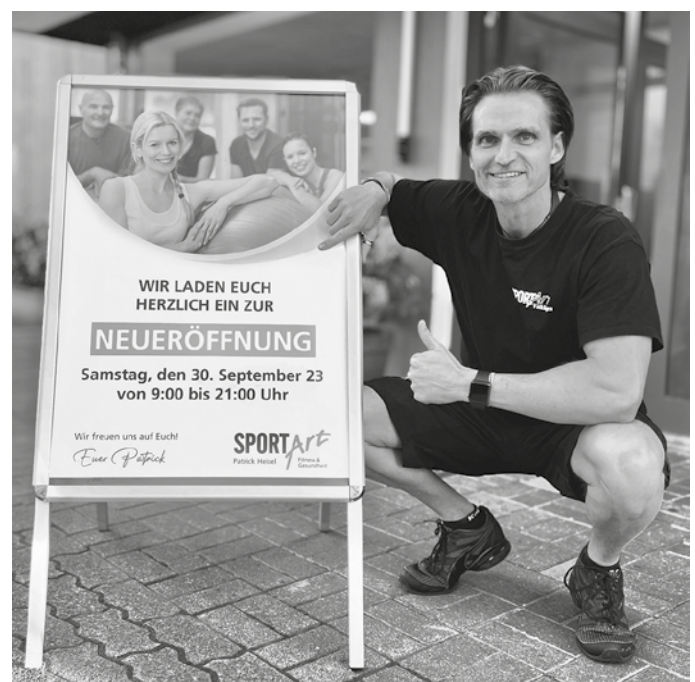
SportART, Neue Straße 23, Völklingen – Luisenthal

Anlässlich des Umzuges bietet das SportART Neumitgliedern tolle Angebote und Abos an. Reinschauen lohnt sich!